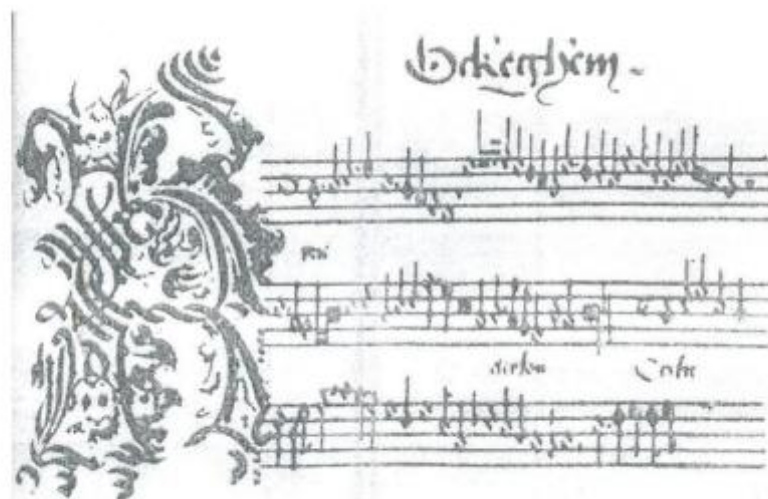
Мензура нота ёзуви 1500 йил

Фақатгина XVII аср бошларига келиб бундай табулатуралар ўрнини ҳақиқий нота ёзуви эгаллай бошлади. Шунини ҳам айтиш мумкин XVII-XVIII асрларда Европа мамлакатларида қўлланилган нота ёзуви системаси ҳозирги кунда жаҳон мамлакатларида фойдаланилаётган нота ёзувиге асос бўлди., даслаб у ҳозирги даражада мукаммал эмас эди. Ҳозирги нота ёзув системаси асосан XIX аср охири ва XX аср бошларига келиб тўла мукаммаллашиб бўлди. Замонавий нота ёзувининг мукаммаллашувида Петербург ва Москва консерваториялари профессорлари Николай Яковлевич Мясковский (1881-1950) ва бошқаларнинг хизматлари бор.