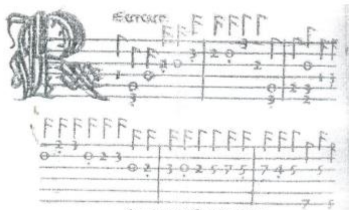
Лютня табулатураси Италия 1507 йил

Фақатгина XVII аср бошларига келиб бундай табулатуралар ўрнини ҳақиқий нота ёзуви эгаллай бошлади. Шунини ҳам айтиш мумкин XVII-XVIII асрларда Европа мамлакатларида қўлланилган нота ёзуви системаси ҳозирги кунда жаҳон мамлакатларида фойдаланилаётган нота ёзувиге асос бўлди., даслаб у ҳозирги даражада мукаммал эмас эди. Ҳозирги нота ёзув системаси асосан XIX аср охири ва XX аср бошларига келиб тўла мукаммаллашиб бўлди. Замонавий нота ёзувининг мукаммаллашувида Петербург ва Москва консерваториялари профессорлари Николай Яковлевич Мясковский (1881-1950) ва бошқаларнинг хизматлари бор.